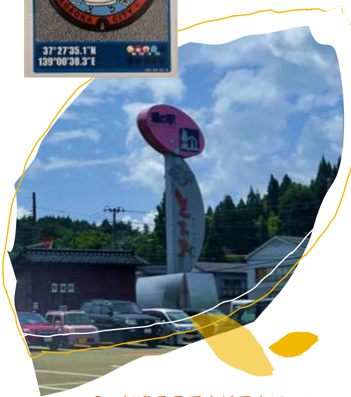
新潟県長岡市栃尾宮沢1764