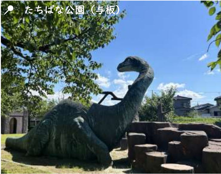
📍 たちばな公園 (与板)