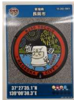
▼マンホールカード

地域特有の様々なデザインが見所です！ぜひお越しいただき、コンプリートを目指してみてくださいはいかがでしょう？！