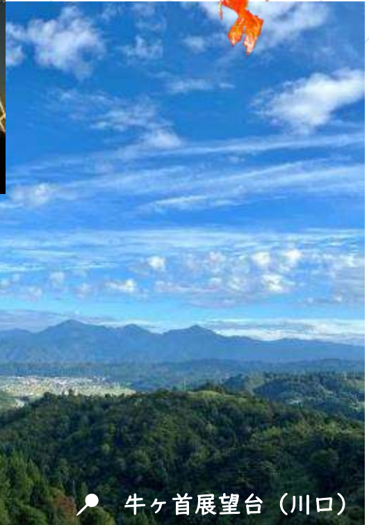
📍 牛ヶ首展望台 (川口)