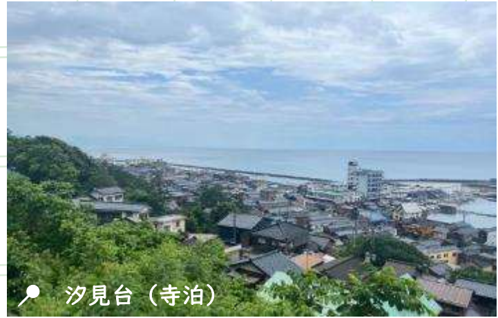
📍 汐見台 (寺泊)