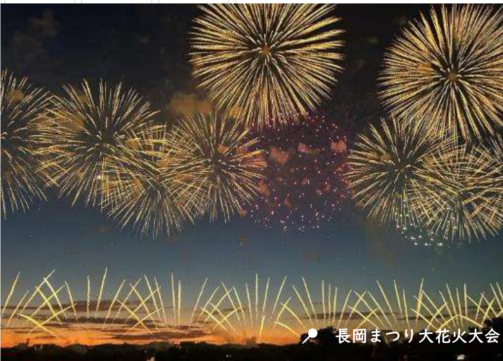
📍 長岡まつり大花火大会