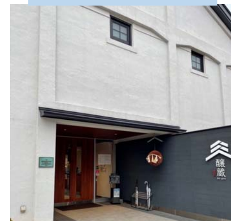
酒ミュージアム醸蔵